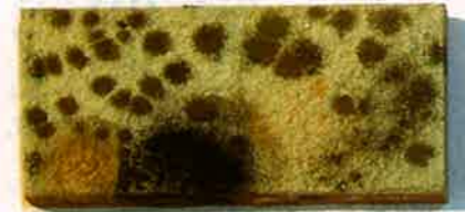
中性、吸放湿機能が高い