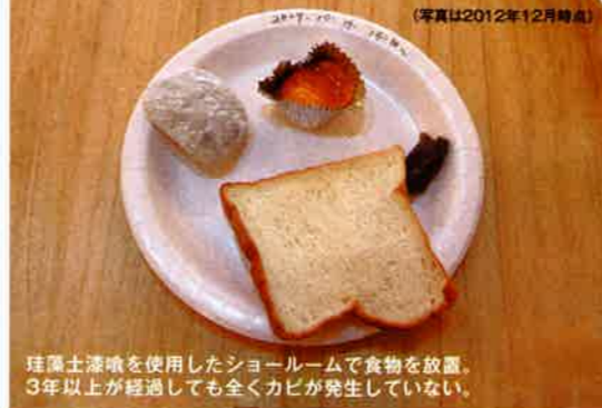
珪藻土漆喰を使用したショールームで食物を放置。3年以上が経過しても全くカビが発生していない。