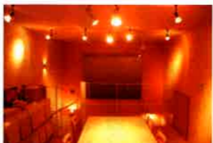
■川崎・高津ショールーム アクセス/東急田園都市線「高津」駅徒歩10分 時間/9:00AM~6:00PM (土日祝要予約) 問合せ/044-820-8117 住所: 神奈川県川崎市高津区久地1-15-2

湿度や室内の空気の違いを体感することができる。塗り体験や実験などを体験できるので、事前に予約をいれてから行くことをオススメする。