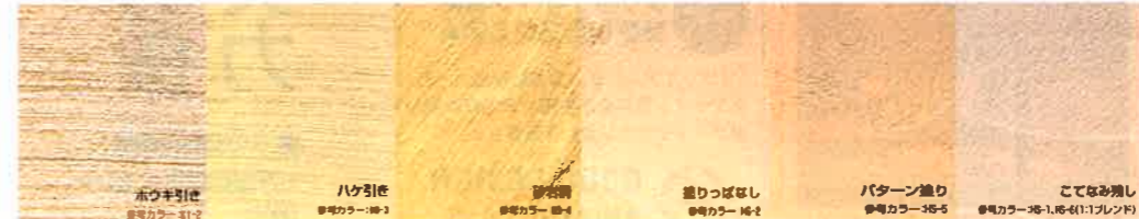
好みのテイストに合わせて、テクスチャーやカラーのバリエーションを豊富に用意している。リビング、ダイニング、寝室、トイレ、玄関など、住まいのそれぞれにぴったりのテクスチャーを選ぶことができ、オリジナルのカラーにも対応できるので、ぜひスタッフに相談してみよう