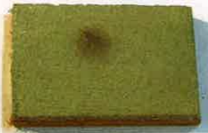
アルカリ性、吸放湿機能が低い