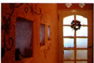
珪藻土漆喰を塗った壁に、娘さんたちが絵を描いた。温かみあふれる空間だ

リフォームを検討する中で、珪藻土漆喰に出合ったKさん家族。ショールームでの体感がよかったです。さらにリフォーム後は、「冬場は結露がなくなり、夏場はエアコンを使わなくても蒸す暑さを感じません。珪藻土漆喰が、一年を通して快適な湿度を保ってくれているのを実感します。わが家は女性が多く、お肌の調子がいいのもうれしいですね」と珪藻土漆喰の恩恵を身をもって感じている。