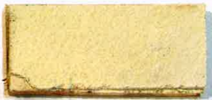
メルシーライト アルカリ性、吸放湿機能が(約200g/㎡)高い