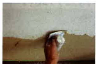
珪藻土漆喰で完全に覆うことで、カビの発生した壁にそのまま施工できる

知ったのが、以前使っていた珪藻土は中性で、カビが発生しやすい成分だったということ。珪藻土漆喰に変えてから3年くらい経ちますが、カビの発生はなく、快適に暮らしています。同社の珪藻土漆喰はリフォームがしやすいことも魅力のひとつ。なんと、カビの発生した壁でも、下地処理をすることで施工できる。もちろん、防カビ処理をすれば、さらに効果が高まるので状況に応じて相談してほしい。