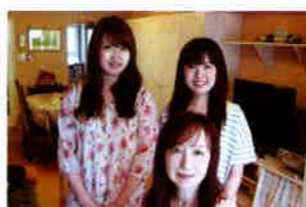
「リフォームしてからお肌の調子がいい」と語るKさん夫人と二人に娘さん