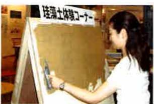
ショールームでは希望すれば塗り体験ができる。施工時に自分で塗ることも可能

珪藻土漆喰の特徴や効果をさまざまな実験をまじえながら、詳しく説明してくれるショールーム。壁には珪藻土漆喰が使われており、快適に保たれた