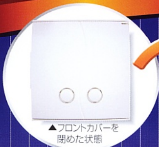
▲フロントカバーを閉めた状態