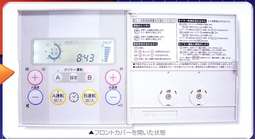
▲フロントカバーを開いた状態