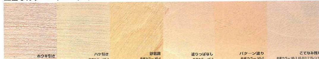
「メルシーシリーズ」は、好みのテイストに合わせて、塗り方や色のバリエーションを豊富にご用意。リビング、ダイニング、寝室、トイレ、玄関など、住まいのそれぞれにぴったりのテクスチャを選ぶことができる。ぜひスタッフに相談してみよう