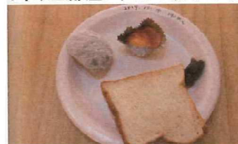
一般にカビやすいとされる食品。1年以上室内に置きっ放しでもカビが全く生えていない