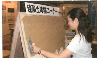
自分で施工可能なので、コストを抑えられる。体験会では、職人が塗り方を教えてくれる