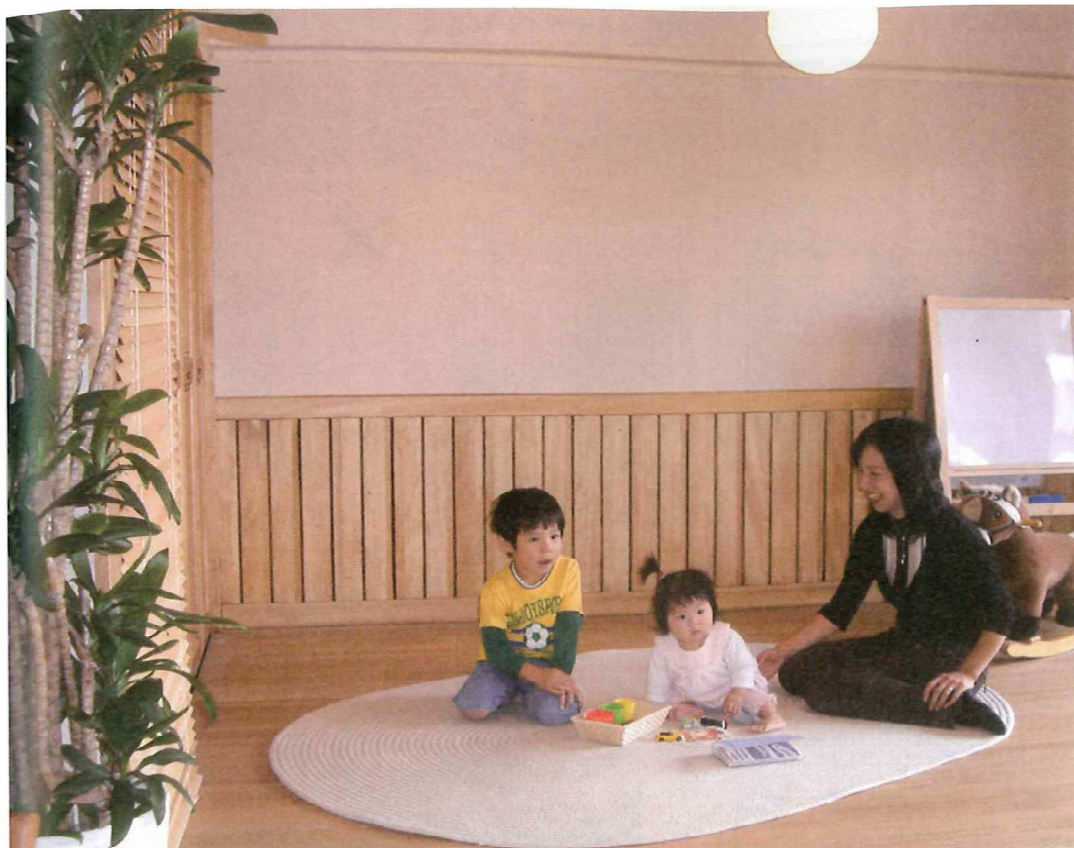
キレイな空気はキレイな体内をつくる源。家族と自分の健康のために、室内の空気はできるだけキレイにしたい。同商品は、アレルギーやぜんそくの原因となるほこり・ダニの発生を低減させ、自然とキレイな空気を保つ