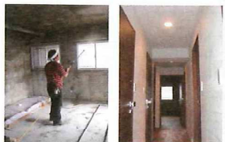
改装前にバイオ液を壁に吹きかける 珪藻土の吸臭・調湿性能がアップ

だわったりリフォームをする方が増えています。私たちが提案するのは、バイオ液を床や壁に吹き付け、改装する空間の中の空気を一度きれいな状態にリセットし、その後バイオ珪藻土などの塗り壁を塗る工程。この工程を入れることにより、部屋に付いている匂いを除去し、珪藻土の性能を高める効果があります。これからは珪藻土もただ塗るだけでなく、いかに効果的に住まいの快適性を上げられるかがカギになってくると思います。