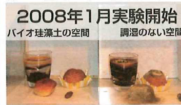
左、バイオ珪藻土はまったくカビが発生せず 右、調湿のない空間はカビだらけとなった