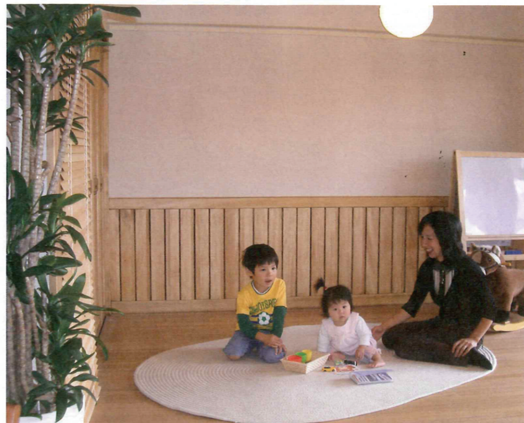
キレイな空気はキレイな体内をつくる源。家族と自分の健康のために、室内の空気はできるだけキレイにしたい。同商品は、アレルギーやぜんそくの原因となるほこり・ダニの発生を低減させ、自然とキレイな空気を保つ